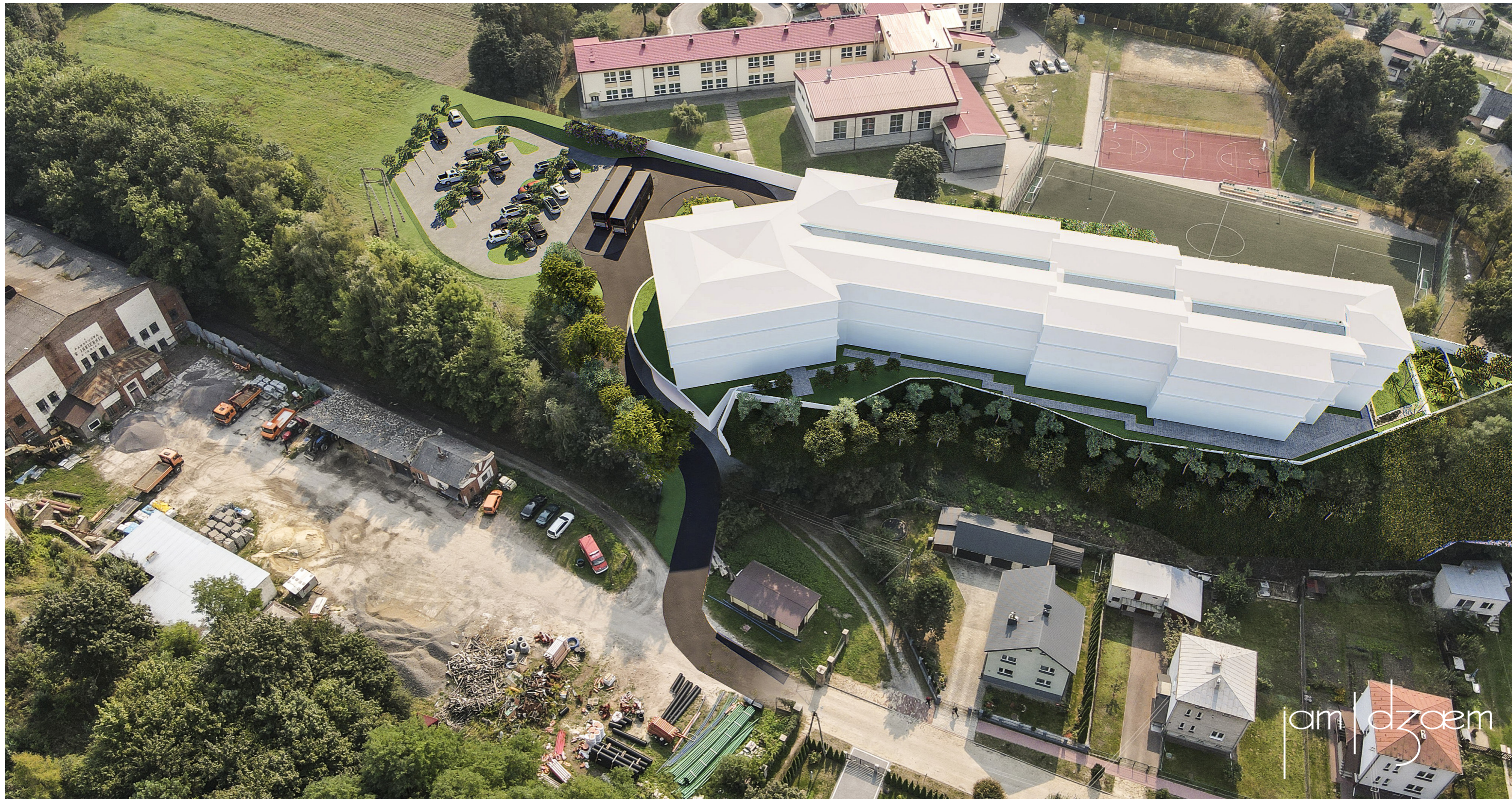
widok nr 4 widok od strony północnej, znad zabudowy przy ulicy Fabrycznej