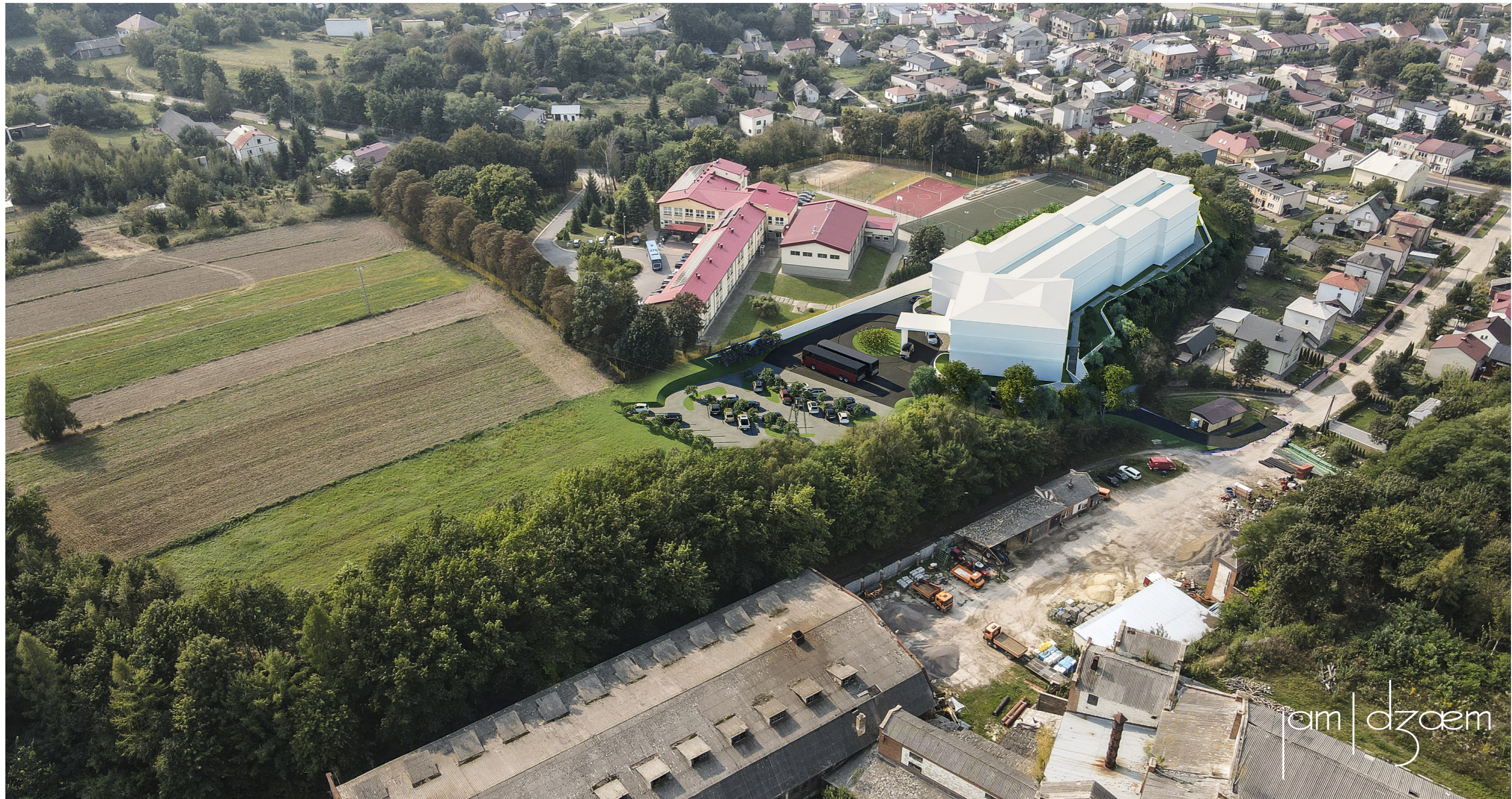
widok nr 1 widok na teren od strony północno-wschodniej, z nad Starej Klinkierni