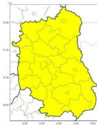
Burze z gradem